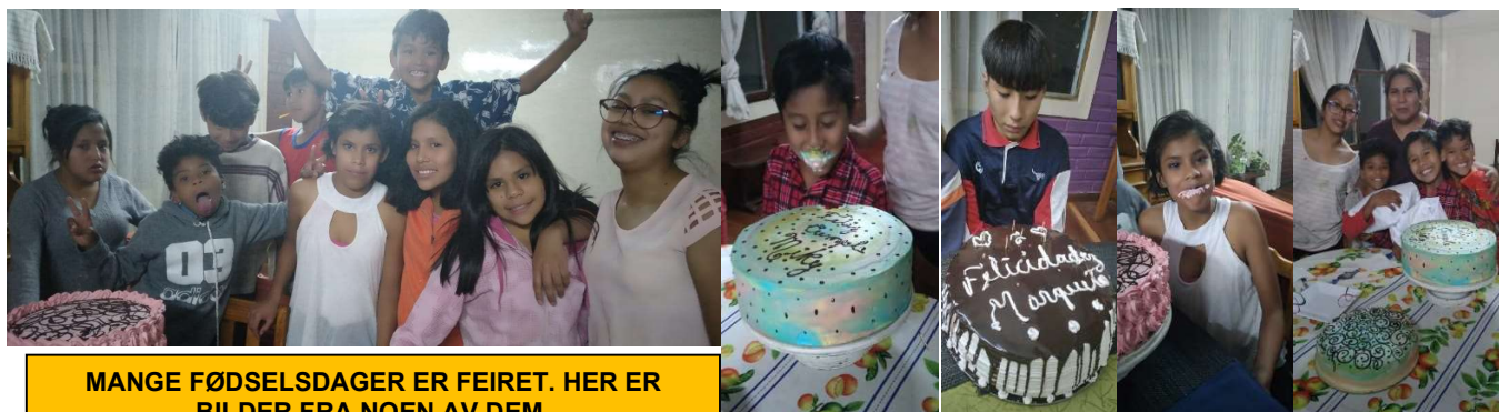
MANGE FØDSELSDAGER ER FEIRET. HER ER BILDER FRA NOEN AV DEM.