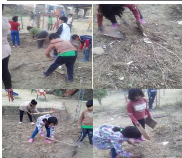
← BARNA ER I GANG MED Å LAGE KJØKKENHAGE