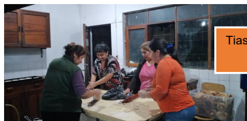
Tias forbereder maten