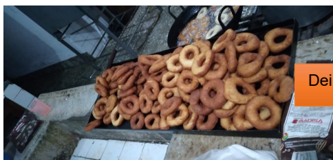
Deilige smultringer å få